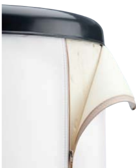
BLANCO: RAL 9016